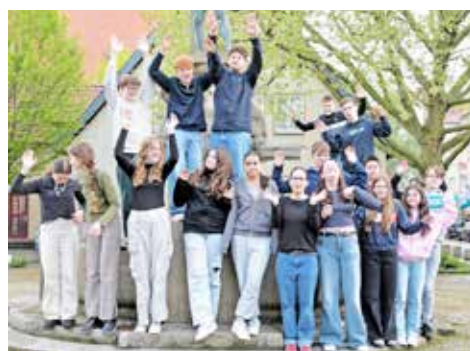
Die nicht ganz komplette Gruppe im April 2024